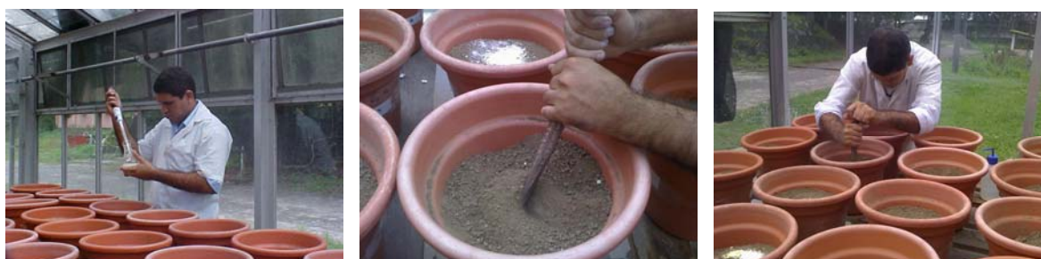
Figura 5. Aplicação de enxofre, gesso e inoculação da bactéria ( Acidithiobacillus ).

Antes do plantio o feijão caupi foi adicionado enxofre elementar inoculado com Acidithiobacillus mais gesso, na dose equivalente a 1000 \text{ kg ha}^{-1} de cada condicionador, visando o controle da sodicidade do solo (Figura 5), com base na metodologia descrita por Stamford et al. (2007b).