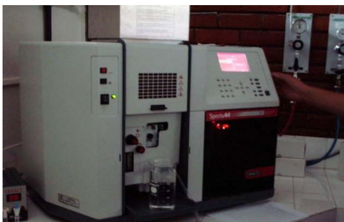
Figura 2. Espectrofotômetro de absorção atômica (aparelho utilizado para leitura dos cátions trocáveis).

A composição granulométrica foi determinada pelo método de BOYOUCOS (1962), após lavagem com etanol a 60% até a eliminação total de cloretos. Utilizando a metodologia descrita pela EMBRAPA (1954) foram determinados: a densidade das partículas, pelo método do balão volumétrico, a densidade do solo pelo método do torrão parafinado.