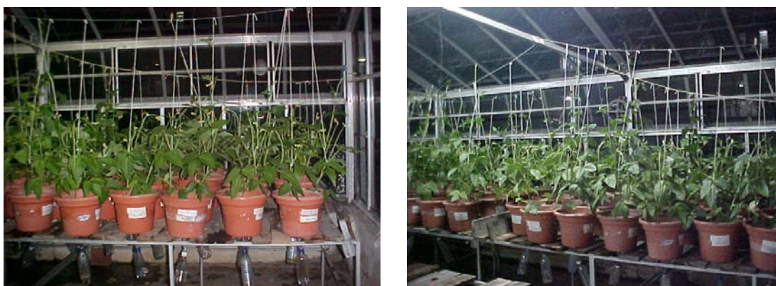
Figura 9. Foto geral antes da colheita.

O controle de umidade foi realizado com uso de sistema de drenagem com mangueira, para o recolhimento de água em excesso, através de garrafas de plástico adaptadas no fundo de cada vaso. Quando as plantas iniciaram a fase de floração (45 dias após a semeadura), foi realizada a colheita (Figura 9), da parte aérea e das raízes com nódulos.