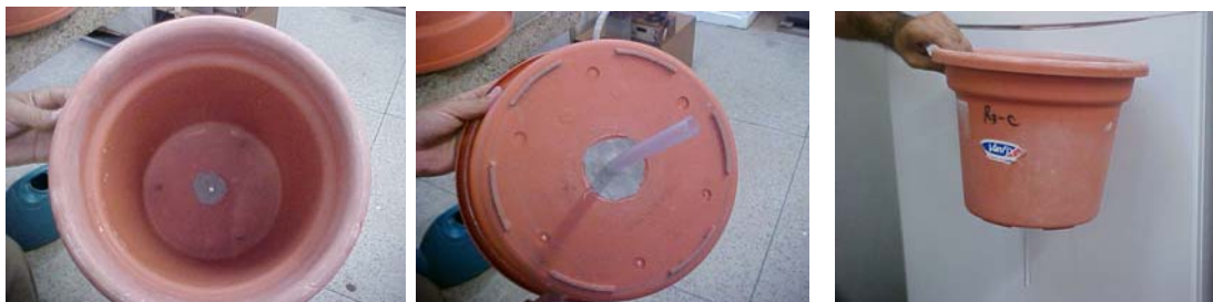
Figura 3. Visualização detalhada dos vasos utilizados no experimento.