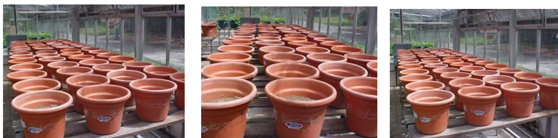
Figura 10. Disposições das unidades experimentais em bloco ao acaso

O experimento foi conduzido no esquema fatorial 2x3x5, usando o delineamento em blocos ao acaso, com três repetições (Figura 10).