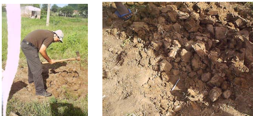
Figura 1. Fotos da coleta do solo (município Serra Talhada - PE).

O experimento foi realizado com um solo de uma área localizada no município de Serra Talhada no Estado de Pernambuco com clima Bsw'h' de acordo com a classificação de Köppen, adaptada no Brasil, muito quente e semi-árido, meso-região do Sertão do Alto Pajeú, tendo o solo sido classificado como solo Neossolo Flúvico salino-sódico textura média (DNOCS, 1999). Amostras do solo foram coletadas na camada de 0 a 20 cm, secas ao ar, destorroadas e peneiradas (peneira de 2 mm), (Figura 1).