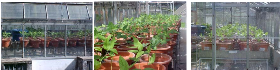
Figura 7. Desenvolvimento do feijão caupi após três semanas do plantio.