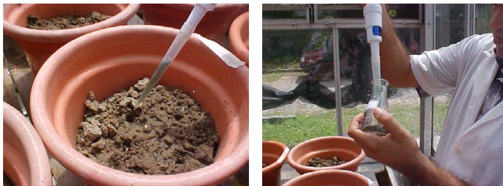
Figura 6. Plantio do feijão caupi e inoculação da estirpe bradyrhizobium BR 3267.

Os inoculantes com as estirpes de rizóbios foram produzidos no Laboratório de Biologia do Solo da Empresa Pernambucana de Pesquisa Agropecuária – IPA, em meio líquido contendo extrato de levedura e manitol (YM) na fase log (após cinco dias de crescimento), sendo considerada uma concentração mínima de 10^8 ufc mL -1 meio, seguindo a metodologia de Vincent (1970). Foram usadas as estirpes NFB 700, SEMIA 6156 e BR 3267, aplicadas isoladamente (Figura 6).