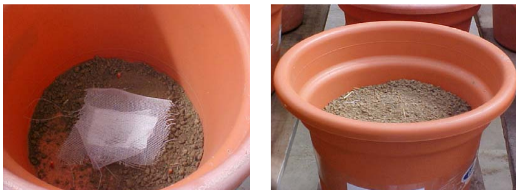
Figura 4. Adição de 6 kg de solo por vaso.

Antes do plantio o feijão caupi foi adicionado enxofre elementar inoculado com Acidithiobacillus mais gesso, na dose equivalente a 1000 \text{ kg ha}^{-1} de cada condicionador, visando o controle da sodicidade do solo (Figura 5), com base na metodologia descrita por Stamford et al. (2007b).