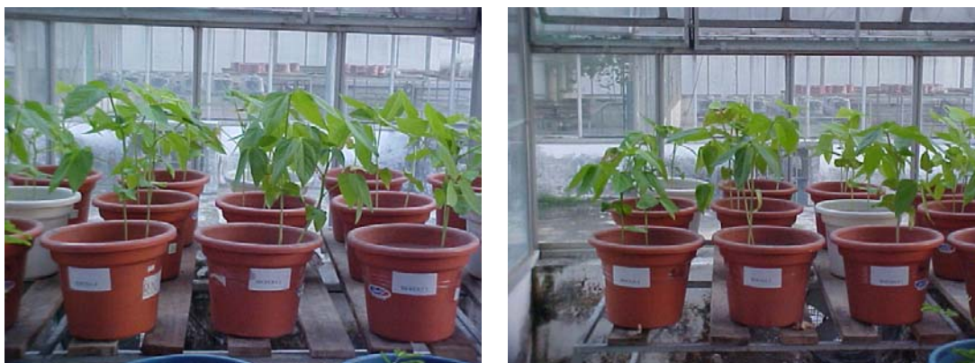
Figura 8. Desenvolvimento do feijão caupi após quatro semanas do plantio.

O controle de umidade foi realizado com uso de sistema de drenagem com mangueira, para o recolhimento de água em excesso, através de garrafas de plástico adaptadas no fundo de cada vaso. Quando as plantas iniciaram a fase de floração (45 dias após a semeadura), foi realizada a colheita (Figura 9), da parte aérea e das raízes com nódulos.